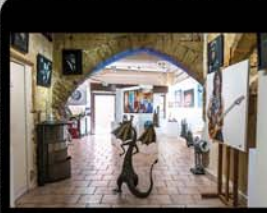
L'Arbre de Jade, galerie d'art

Des univers artistiques très éclectiques dans un espace du xix e siècle où des peintres, des sculpteurs, des céramistes, émergents côtoient des artistes reconnus.