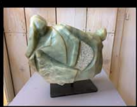
Noëlle Daudy-Jolivet, peintre et sculpteur

Sans limite ni contrainte, l'artiste se livre entièrement à un abstrait délivréur d'images subliminales. Son univers étouffe et attire. Terre, bronze, pierre, verre, métal... Noëlle sculpte sur tous les matériaux, libérant une énergie empreinte de sa personnalité. Ses peintures vous feront voyager dans un monde harmonieux haut en couleurs.