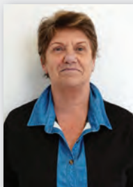
Les trois agents chargés du recensement à Mèze