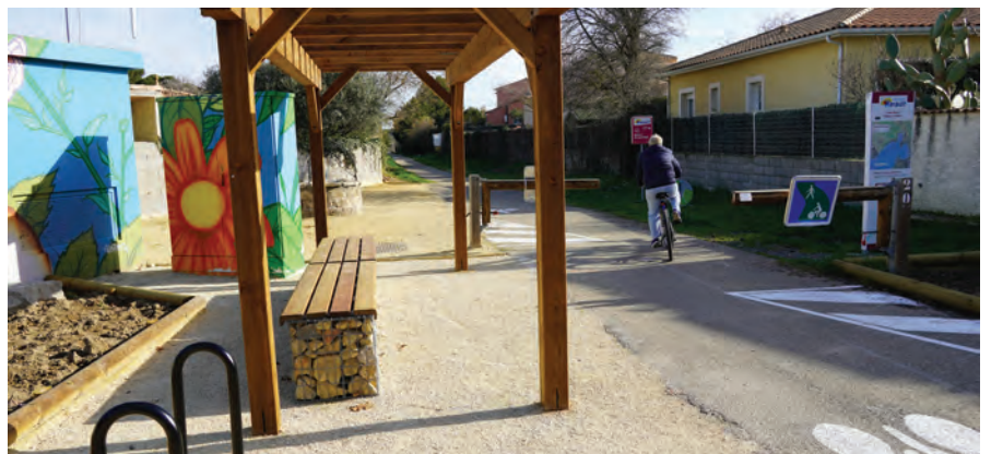
Les derniers aménagements de la piste cyclable menant à Loupian.

Avec une moyenne remarquable de 4,35/5, Mèze fait désormais figure d'exemple en matière de mobilité cyclable.