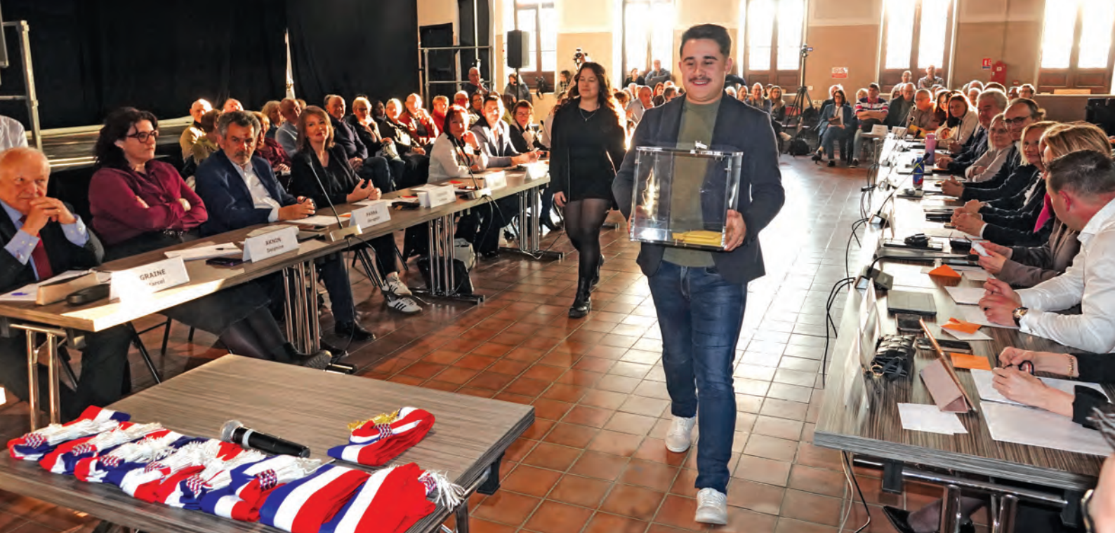
Le conseil municipal d'investiture du maire et des adjoints